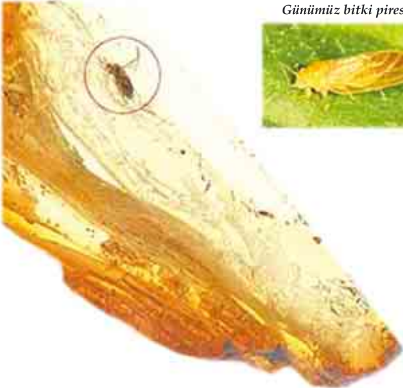
Günümüz bitki piresi

Dönem: Senozoik zaman, Eosen dönemi Yaş: 50 milyon yıl Bölge: Polonya